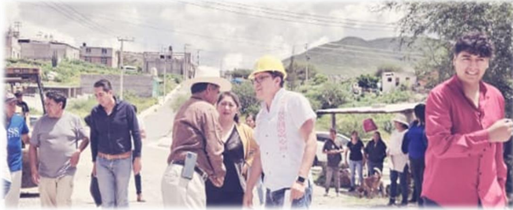
SECRETARIO DEL AYUNTAMIENTO

Asistí al arranque de obra de la pavimentación en la calle de la comunidad de Xuchitlan el cual es un proyecto de gran impacto para la población, en virtud de que